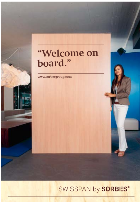
SWISSPAN by SORBES +

Dachmarke und Produktmarken: Eine enge Verbindung für den gemeinsamen Erfolg.