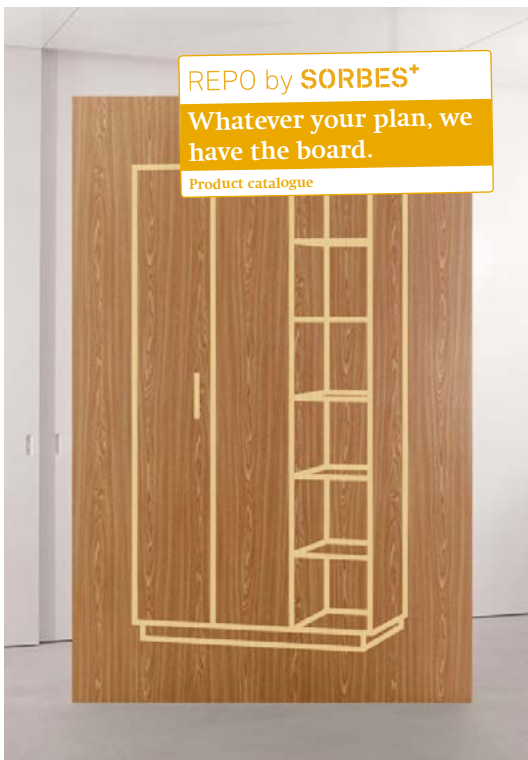
Beispiel Produktkatalog: Die Botschaft bleibt in allen Teilen mit dem Board verbunden.

nie, vom Entstehungs- bis zum Einsatzort, gehalten von Mitarbeitern, Kunden und Endusern als Kunden der Kunden.